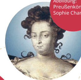
Abbildung: Preußenkönigin Sophie Charlotte

Im Schlossmuseum und bei regelmäßigen Führungen im Rittersaal und im angeschlossenen Münzkabinett gibt es viel zu entdecken. Erhalten Sie lebendige Einblicke in das Leben im Schloss und lernen Sie die beeindruckende Persönlichkeit von Sophie Charlotte kennen. Bequeme Spazierwege am Schlossberg und zwei Gärten bieten atemberaubende Blicke und laden zum Entspannen ein.